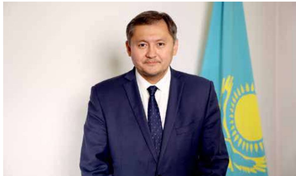
САЯСАТ НҰРБЕК, ҚАЗАҚСТАН РЕСПУБЛИКАСЫ ҒЫЛЫМ ЖӘНЕ ЖОҒАРЫ БІЛІМ МИНИСТРІ

Жыл қорытындысы: жаңа жатақханалар, білім беру гранттары мен шәкіртақыларды көбейту және шетелдік университеттердің филиалдарының ашылуы